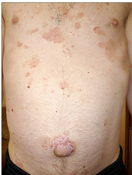
Рис. 7. Псориаз у больного циррозом печени.