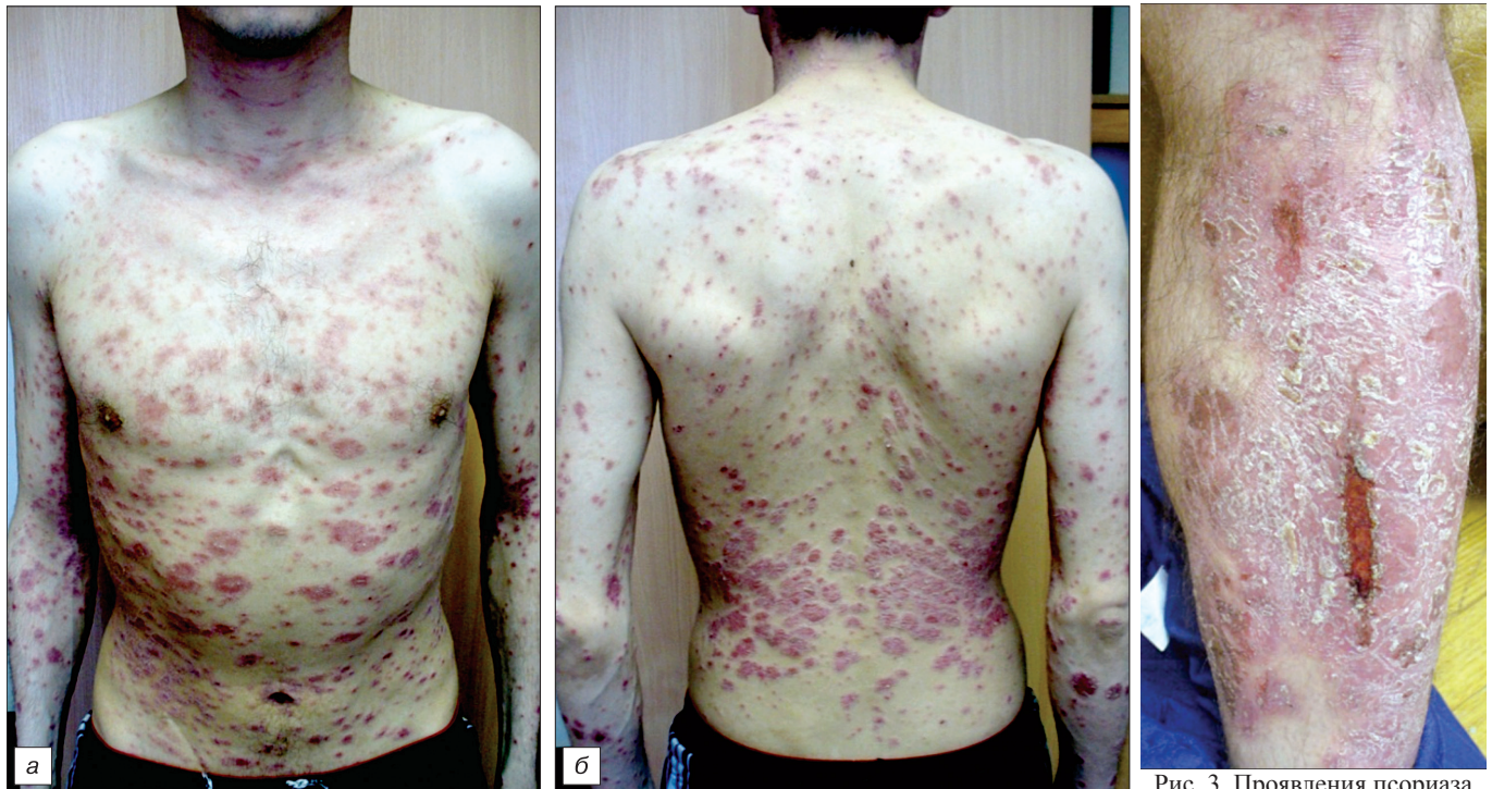
Рис. 2. Экссудативный псориаз (а, б).