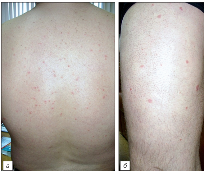
Рис. 11. Каплевидный псориаз (а, б).