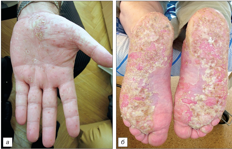
Рис. 9. Ладонно-подошвенный псориаз (а, б).