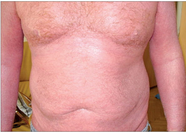
Рис. 10. Псориагическая эритродермия.