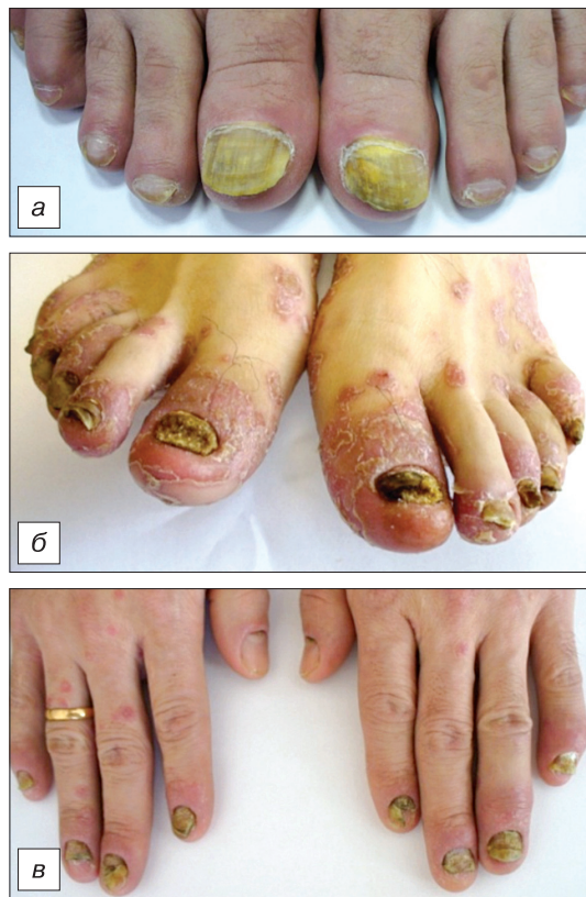
Рис. 5. Псориаз ногтей (а, б, в).