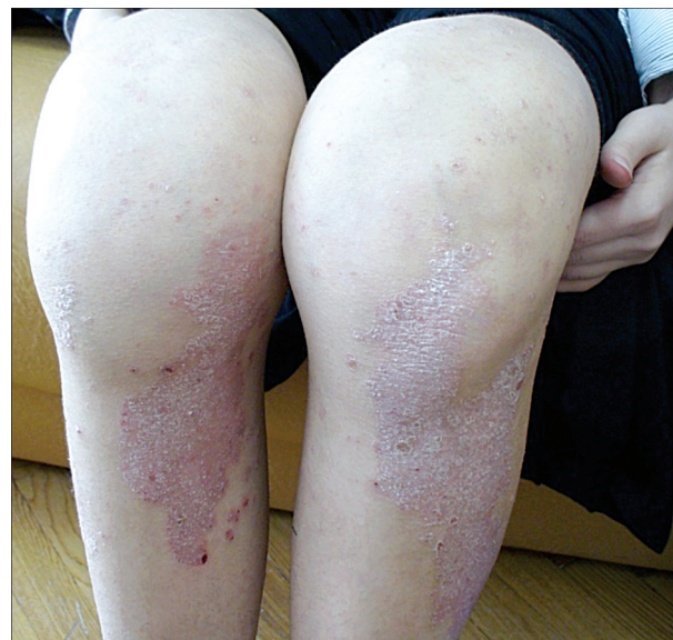
Рис. 8. Псориагический артрит.