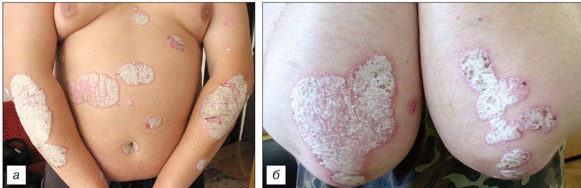
Рис. 1. Вульгарный псориаз (а, б).

For citation: From collection of docent Tarasenko G.N. Clinical forms of psoriasis. Russian Journal of Skin and Venereal Diseases (Rossiyskii Zhurnal Kozhnykh i Venericheskikh Boleznei) . 2016; 19(1): 69-71. (in Russian). DOI 10.18821/1560-9588-2016-19-1-69-71