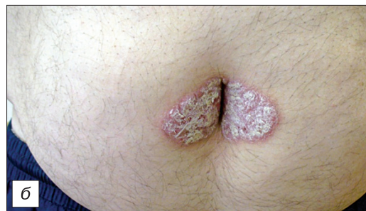
Рис. 6. Инверсный псориаз (а, б).