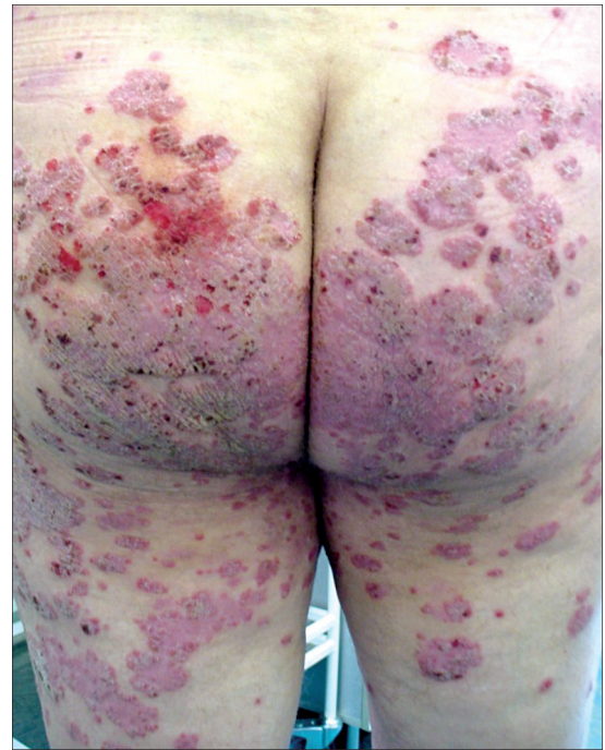
Рис. 12. Экссудативный псориаз.